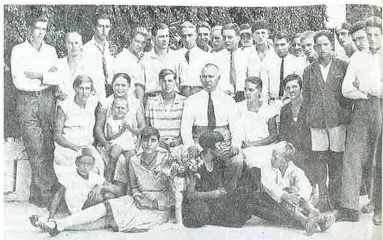
Ekipa "Juga" 1927. g., Sušak — nalazi se pet Dabrovića

Plivački savez Jugoslavije osnovan je u Zagrebu 1921. godine. Zagreb, Karlovac, a osobito gradovi s Jadranske obale, Sušak, Šibenik, Split i