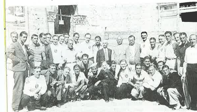
Proslava 10-godišnjice "Juga" 1934. g. — Dubrovnik